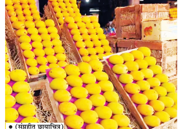
● (संग्रहीत छायाचित्र)

। नवी मुंबई । प्रतिनिधी । आंब्याचा सिझन सुरू झाला तरी वाशीच्या घाऊक बाजारात कोकणातून हापूस आंब्याची हवी तशी आवक होत नाही. आताही बाजारात केवळ सरासरी ३० हजार पेठ्यांचीच आवक बाजारात होत आहे. त्यामुळे मुख्य हंगाम सुरू झाला तरी बाजारात हवे तसे हापूस आंबे बघायला मिळत नाहीत. एकूणच कोकणातील आंब्याची परिस्थिती पाहता उत्पादन यावर्षी कमीच आहे. त्यामुळे बाजारात हापूस आंब्याची आवक कमी होत आहे. मात्र, दि. १० एप्रिल नंतर कोकणातील हापूस आंब्याची आवक वाढणार असल्याचा विश्वास व्यापाऱ्यांनी व्यक्त केला आहे.