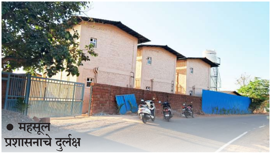
● महसूल प्रशासनाचे दुर्लक्ष

। श्रीवर्धन । प्रतिनिधी । सध्या श्रीवर्धन तालुक्यामध्ये अनाधिकृत बांधकामांना ऊत आला आहे. महसूल प्रशासनाकडून होत असलेल्या दुर्लक्षामुळे अनेक ठिकाणी नवीन अनाधिकृत बांधकामे उभी केली जात आहेत. ही बांधकामे करणारे स्थानिक कमी असून बाहेरून आलेले धनदांडोच असल्याचे पाहायला मिळत आहे. यामध्ये अनेक ठिकाणी वनविभागाचा शिक्षा असलेल्या जागांवरती देखील बांधकाम करण्यात आलेले आहे. केंद्र शासनाच्या परवानगीशिवाय वनैतर कामास बंदी अशा प्रकारचे शिक्के असलेल्या जागांवरती देखील मोठमोठे बंगले उभे राहत आहेत. महसूल प्रशासन आणि वनविभाग यांचा ही अनाधिकृत बांधकाम करणाऱ्यांना आशीर्वाद आहे का? असा प्रश्न जागरूक नागरिकांना पडला आहे.