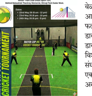
सायंकाळी ६.०० वाजल्यापासून सामने खेळवले जाणार आहेत. कोर्टवर खेळण्या जाणाऱ्या या स्पर्धेत प्रत्येक संघात १२ खेळाडूंचा समावेश असणार असून, प्रत्यक्ष मैदानावर एका

। मुंबई । प्रतिनिधी । मुंबईकर क्रिकेटप्रेमींना आता पारंपरिक क्रिकेटसोबतच वेगवान, आक्रमक आणि थारक इनडोअर क्रिकेटची भ्रमरात मेजवानी अनुभवायला मिळणार आहे. महामुंबई इनडोअर क्रिकेट स्पोर्ट्स असो.तर्फे दि.२२ ते २४ मे दरम्यान महापौर चषक इनडोअर क्रिकेट स्पर्धेचे आयोजन करण्यात आले आहे. दादरच्या शिवाजी पार्क परिसरातील पार्क क्लबच्या अर्बन स्पोर्ट टर्फवर क्रिकेटचा हा नवा अवतार रंगणार आहे. दि.२२ मे रोजी सकाळी ८ ते १२ वाजेपर्यंत, तर दि.२३ आणि २४ मे रोजी