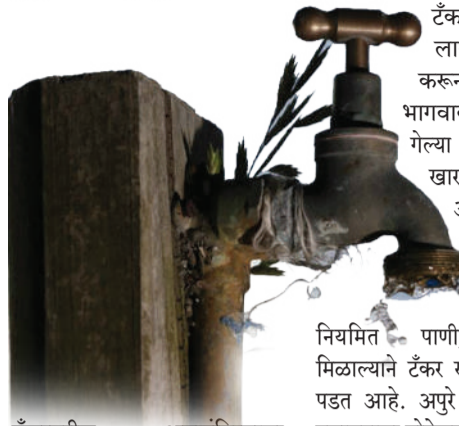
टँकरवरील अवलंबित्वाचा लेखाजोखा सादर केला जाणार आहे.