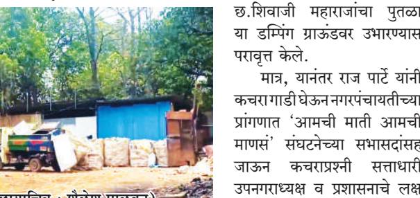
● (छायाचित्र : शैलेश पालकर)

राहिले आहे. पोलादपूर नगरपंचायतीने वर्षाला ७९ लाख रुपयांची निविदा कचरा उचलून विल्हेवाट लावण्याकामी ठेकेदाराला दिल्यानंतरही सफाई कामगारांची संख्या कमी असतानाही जास्त संख्या दाखवून रोजमजुरीवर डड्डा मारणे तसेच कचऱ्यातील प्लास्टिकच्या वस्तूंचे तांबे, पितळ, स्टील आदी धातूच्या वस्तूंना चरई फाट्याजवळील भंगारविक्रेत्याकडे कचरा गाडी उभी करून रितसर वजनकाट्यावर पिशाव्या ठेऊन वजन करून कचऱ्यातून भंगारविक्रीचाही प्रकल्प राबविण्यात आला असल्याचे फोटो व व्हिडीओ सोशल मिडीयावर व्हायरल झाले आहेत.