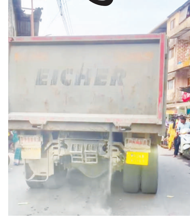
माध्यमांवर हा व्हिडिओ देखील मोठ्या प्रमाणावर फिरत होता. गेल्या आठवड्यात ग. बा. वडेर हायस्कूलजवळही अशीच घटना घडली होती. रस्त्यावर सांडलेल्या खडीमुळे दुचाकी घसरून अपघात होण्याचे प्रमाण वाढले असून, शाळकरी विद्यार्थ्यांना चालणेही कठीण झाले आहे.

रविवारी (दि. २६) मुख्य रस्त्यावरून जाणाऱ्या एका डंपरमधून मोठ्या प्रमाणावर बारीक खडीचा भुगा (ग्रीट) सांडत होता. यामुळे संपूर्ण परिसरात धुळीचे लोट उसळले होते. ज्यामुळे पादचारी आणि दुचाकीस्वारांना धुळीने आंघोळ करण्याची वेळ आली. समाज