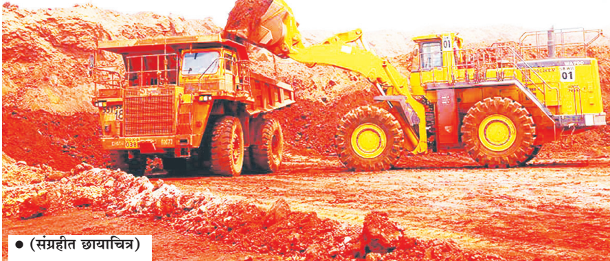
● (संग्रहीत छायाचित्र)

श्रीवर्धन तालुक्यातील मेघरे येथे प्रस्तावित बॉक्सार्ट खाण प्रकल्पाच्या जनसुनावणीवर आता गंभीर संशयाचे ढग दाटून आले आहेत. लोकशाही प्रक्रियेचा गळा घोटत संपूर्ण जनसुनावणीच गुप्ततेच्या आवरणत पार पडल्याचा आरोप होत असून, स्थानिक पत्रकारांना जाणीवपूर्वक दूर ठेवून प्रशासनाने नेमके काय लपवण्याचा प्रयत्न केला? असा संतप्त सवाल जनतेतून उपस्थित होत आहे. सर्वांत धक्कादायक बाब म्हणजे सुनावणीस्थळी पत्रकारांसाठी स्वतंत्र कक्ष आणि आसनव्यवस्था करण्यात आली होती; मात्र, तालुक्यातील एकाही अधिकृत पत्रकाराला याबाबत ना निमंत्रण, ना पूर्वसूचना, ना कोणतीही अधिकृत माहिती देण्यात आली. मग ही पत्रकारांसाठीची व्यवस्था केवळ कागदोपत्री दिखावा होता का? जनसुनावणी केवळ औपचारिकता पूर्ण करण्यासाठीच