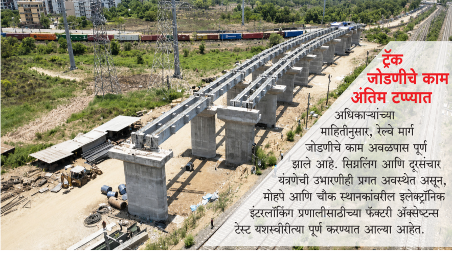
ट्रॅक जोडणीचे काम अंतिम टप्प्यात

या नव्या रेल्वे मार्गामुळे कल्याण मार्गावरील वाढता ताण कमी होण्यास मदत होणार असून, नवी मुंबई, रायगड आणि कर्जतदरम्यानच्या रेल्वे संकाला नवी गती मिळणार आहे. मुंबई अर्बन ट्रान्सपोर्ट प्रकल्प ३ अंतर्गत २९.६ किलोमीटर लांबीचा दुहेरी रेल्वे मार्ग उभारण्यात येत आहे. प्रकल्पासाठी आवश्यक सर्व जमीन संपादन पूर्ण झाले असून, वन विभागासह विविध यंत्रणांकडून आवश्यक मंजुरी मिळाल्या आहेत.