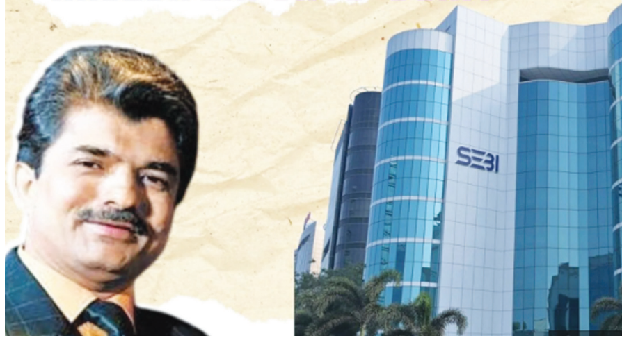
आकडे संशयास्पद ठरल्यास संपूर्ण व्यवस्थेवरील विश्वास डळमळीत होतो.

भारतीय शेअर बाजाराने गेल्या काही दशकांमध्ये अनेक चढ-उतार पाहिले आहेत. काही कंपन्यांनी आपल्या कामगिरीने गुंतवणूकदारांचा विश्वास जिंकला, तर काहींनी फसवणूक, गैरव्यवहार आणि दिशाभूल करणाऱ्या आर्थिक अहवालांमुळे बाजाराच्या विश्वासाला तडा दिला. अलीकडेच समोर आलेल्या 'राजेश एक्सपोर्ट्स' प्रकरणाने कंपनीच्या बॅलन्स शीटमध्ये दिसणारे आकडे कितपत खरे असतात आणि त्यांची पडताळणी करणाऱ्या यंत्रणा कितती सक्षम आहेत, असा प्रश्न पुन्हा एकदा उपस्थित केला आहे. सामान्य माणूस 'पंधरा लाख कोटी रुपयांचा घोटाळा' असा शब्दप्रयोग ऐकतो, तेव्हा त्याच्या डोक्यासमोर देशातील सर्वात मोठ्या आर्थिक गैरव्यवहारांचे चित्र उभे राहते. पंधरा लाख कोटी रुपये ही रक्कम इतकी प्रचंड आहे, की तिची कल्पना करणेही अवघड आहे. भारताच्या वार्षिक निर्यातीच्या मोठ्या भागाइतकी ही रक्कम आहे. त्यामुळे तीन हजार कोटी रुपयांच्या बाजारमूल्याची कंपनी इतक्या मोठ्या आकड्यांशी जोडली जाते, तेव्हा सामान्य गुंतवणूकदार गोंधळून जातो; परंतु या प्रकरणाचा गाभा समजून घेतला, तर लक्षात येते, की येथे पैशांची चोरी किंवा बँकांचे कर्ज बुडवण्यापेक्षा अधिक गंभीर ठरणाऱा प्रश्न आहे तो आर्थिक विश्वासासहतेचा. शेअर बाजार विश्वासावर उभा असतो. गुंतवणूकदार एखाद्या कंपनीचे शेअर्स खरेदी करताना तिच्या उत्पादनावर नव्हे, तर आर्थिक अहवालांवर, लेखापरीक्षणावर आणि व्यवस्थापनाच्या प्रामाणिकपणावर विश्वास ठेवतो. कंपनीने जाहीर केलेले उत्पन्न, नफा, मालमत्ता आणि व्यवसायाच्या व्याप्तीसंदर्भातले सर्व आकडे गुंतवणूकदारांच्या निर्णयाला दिशा देतात. हेच