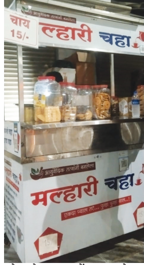
जोडणारे मुख्य केंद्र असलेल्या पनवेल बस स्थानक परिसरात

पनवेल बस स्थानक परिसरात महाराष्ट्र स्वीटस कॉर्नर्समोर उड्डाणपूलाखाली रात्रीच्या वेळी नियमांचे उल्लंघन करून बेकायदेशीर चहाच्या टपच्या आणि दुकाने रात्रभर सुरू राहत असल्याचा धक्कादायक प्रकार समोर आला आहे. या टपच्यावर प्रतिबंधित गुटरखा, सुगंधित तंबाखू आणि सिगारेटची राजरोसपणे मोठ्या प्रमाणावर विक्री केली जात आहे. या वादल्या अवैध व्यवसायावर अन्न व औषध प्रशासनाने तातडीने कडक कारवाई करावी, अशी मागणी स्थानिक नागरिकांकडून केली जात आहे. मुंबई आणि कोकणला