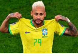
बहुप्रतिक्षित पुनरागमनाला विलंब झाला आहे. सामन्यापूर्वी बोलताना अँसेलोटी यांनी सांगितले की, नेयमार दुखापतीतून सावण्यात चांगली प्रगती करत आहे. लवकर बरा होण्यासाठी तो खूप मेहनत घेत आहे. आम्ही त्याला केवळ त्याच्या निर्दिष्ट फुटबॉल कौशल्यासाठीच नव्हे, तर संघातील तरुण खेळाडूंना तो देऊ शकणाऱ्या अनुभवासाठी बोलतावे आहे.

। न्यूयॉर्क । वृत्तसंस्था । ब्राझिलला फिफा विश्वचषक स्पर्धेच्या कारकिर्दीवर सध्या ज्युनियर शिवाय करावी लागणार आहे. संघाचे मुख्य प्रशिक्षक कार्लो अँसेलोटी यांनी या वृत्ताला दुजोरा देताना ‘क’ गटातील मोरोक्कोविरुद्धचा सामन्यात नेयमार खेळणार नसल्याचे स्पष्ट केले. पाचवेळच्या विश्वचषक विजेता ब्राझील २०२२च्या विश्वचषक स्पर्धेच्या उपांत्य फेरीत धडक मारणाऱ्या मोरोक्कोला शनिवारी न्यू यॉर्कच्या न्यू जर्सी स्टेडियमवर भिडणार आहे. परंतु, पोटीच्या दुखापतीमुळे नेयमारच्या आंतरराष्ट्रीय स्तरावरील