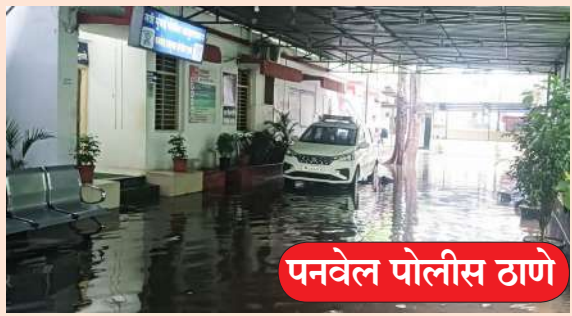
पनवेल पोलीस ठाणे

● गेले दोन दिवस मुरुड तालुक्यात पडत असलेल्या दमदार पावसामुळे रविवारी येथील रस्ते, नद्या-नाले व शेती पाण्याने भरली. येथील जनजीवन विस्कळीत झाले असले, तरी शहरातील मुलांनी पावसात भिजण्याचा मनसोक्त आनंद देखील लुटला.