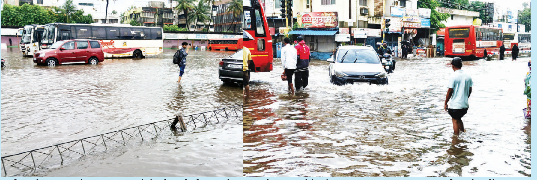
● शनिवार रात्रीपासून पडत असलेल्या मुसळधार पावसामुळे सोमवारी सकाळी अलिबाग एस.टी. स्थानक व परिसर पाण्याखाली गेला होता.

रायगड जिल्ह्यात मुसळधार पावसाने हाहाकार उडविला आहे. शनिवारी (दि.४) रात्रीपासून पडत असलेल्या मुसळधार पावसामुळे रविवारी (दि.५) अलिबाग शहरातील अलिबाग एसटी स्टॅण्ड, तळकर नगर, श्रीबाग, बायपास रोड व रामनाथ परिसरात पावसाचे पाणी घुसले होते. अलिबाग-रेवडंडा मार्गावरील नागाव येथील मुख्य रस्ता पाण्याखाली गेला होता. अनेक वाहने बंद पडल्याने ती दळलत नेताना मोठी कसरत करावी लागत होती. कुटुंबांची गोठी गावातून पुरावे पाणी वाहत होते. तसेच, मुरुड तालुक्यातील उर्सोली आणि खैरवाडी येथील रस्ता पाण्याखाली गेला. रोहा तालुक्यात एका फार्महाऊस मध्ये पर्यटक अडकले होते. तर, उरणसह पनवेल, श्रीवर्धन, महाड, पोलादपूर, खालापूर, कर्जत, पेण या तालुक्यांत देखील पुरस्थिती निर्माण झाली होती. अनेक ठिकाणी घरात पाणी शिरले असून मोठे नुकसान झाले आहे. तर, काही ठिकाणी दरड आणि झाडे कोसळून वाहतूक ठप्प झाली होती. तसेच, काही गावांचा संपर्क देखील तुटला होता. काही ठिकाणी पर्यटक देखील अडकले होते.