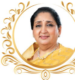
सुनेत्रा अजित पवार, उपमुख्यमंत्री

आदरणीय भाई जयंत पाटील हे महाराष्ट्राच्या सार्वजनिक जीवनातील एक अभ्यासू, संयमी आणि तत्त्वनिष्ठ नेतृत्व म्हणून सर्वपरिचित आहेत. सामाजिक, राजकीय आणि सहकार क्षेत्रात भाई जयंत पाटील यांनी दिलेले योगदान अत्यंत उल्लेखनीय आहे. जनसामान्यांच्या प्रश्नांना प्राधान्य देत लोकहिताचा सातत्याने पुरस्कार करणारे नेतृत्व म्हणून त्यांनी आपली वेगळी ओळख निर्माण केली आहे. महाराष्ट्राच्या राजकीय आणि सामाजिक जडणघडणीत त्यांनी बजावलेली भूमिका आणि विविध क्षेत्रांत घेतलेले दूरदृष्टीचे निर्णय प्रेरणादायी ठरले आहेत.