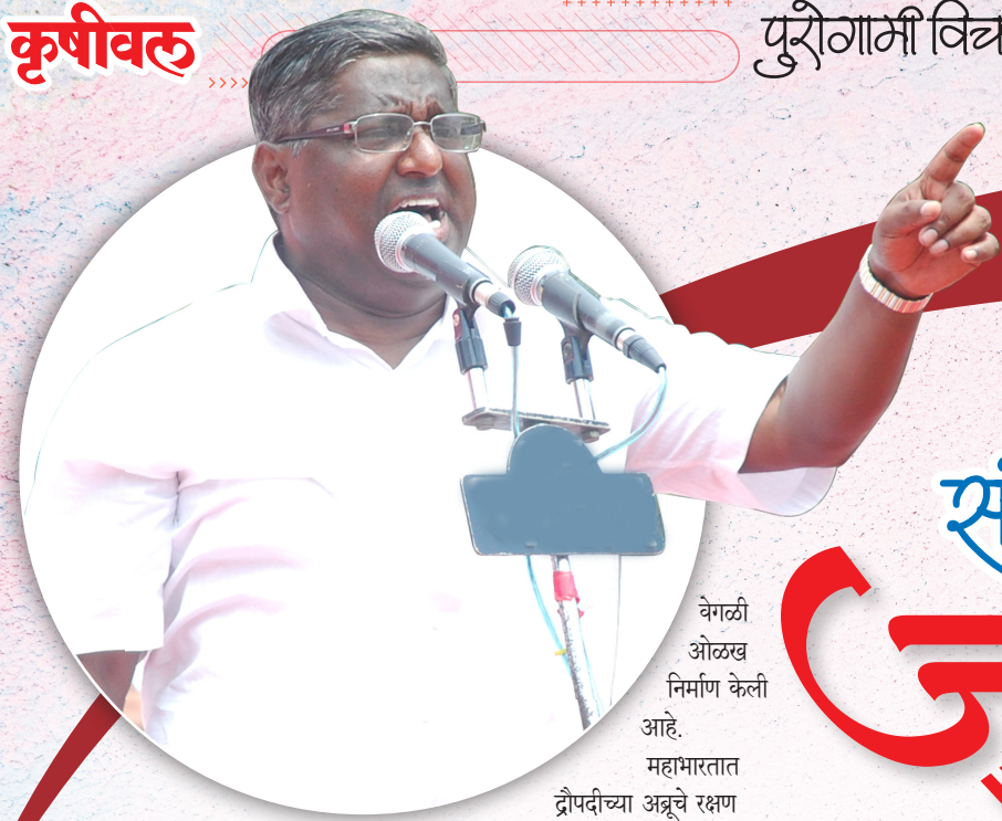
वेगळी ओळख निर्माण केली आहे.