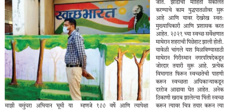
माझी वसुंधरा अभियान भूमी या घटकांतर्गत शहरातील हेरिटेज ट्री म्हणजे १०० वर्षे आणि त्यापेक्षा जास्त वर्षे जुनी असलेल्या मिळविले

माथेरान स्वच्छ सर्वेक्षण २०२२ साठी माथेरान नगरपालिकेने आतापासूनच कंबर कसली आहे. अधिकारी स्वतः प्रत्येक विभागात जाऊन स्वच्छतेविषयी पाहणी करून वेगवेगळ्या युक्त्या करीत आहे. मागील वर्षी क्रमांक न आल्याने येणाऱ्या सर्वेक्षणात चांगली कामगिरी करून माथेरानचे नाव उंचावण्याचे आवाहन पालिकेच्या प्रशासनावर आहे. त्यासाठी जुन्या झाडांचा सव्हे, रंगरंगोटी, जागोजागी स्वच्छता याकडे विशेष लक्ष दिले जात आहे. स्वच्छ सर्वेक्षण २०२२ आणि