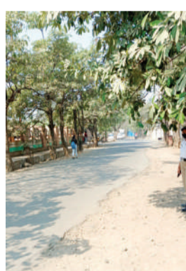
त्यानुसार वाहतूक विभागाने नियमांचे उल्लंघन करणाऱ्या वाहनचालकांवर कारवाईचा बडगा उगारला. अखेर वाहतूक विभागाच्या पुढाकाराने

शहरातील न्यायालयाच्या परिसरात चारचाकी वाहनांना सोमवार ते शुक्रवार म्हणजेच कार्यालयीन कामकाजाच्या दिवशी 'नो पार्किंग' बाबत आणि दुचाकी वाहनांना 'सम विषम पार्किंग' बाबतची अधिसूचना पनवेल शहर वाहतूक विभागाच्यावतीने घोषित करण्यात आली होती. न्यायालयासमोरील परिसरात कार्यालयाचे वेळेत चारचाकी वाहने पार्किंग केल्यास व दुचाकीस्वारांनी सम-विषम पद्धतीने वाहने पार्किंग न केल्यास कारवाईस सामोरे जावे लागेल, असे आवाहनही वाहतूक विभागाकडून करण्यात आले होते.