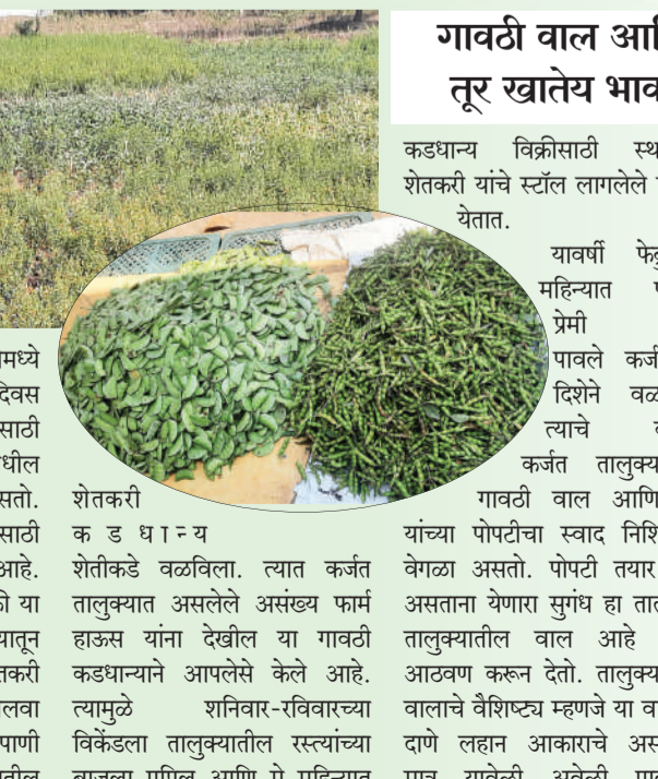
गावठी वाल आणि तूर खातेय भाव कडधान्य विक्रीसाठी स्थानिक शेतकरी यांचे स्टॉल लागलेले दिसून येतात. यावर्षी फेब्रुवारी महिन्यात पोपटी प्रेमी यांची पावले कर्जतच्या दिशेने वळतात. त्याचे कारण कर्जत तालुक्यातील गावठी वाल आणि तूर यांच्या पोपटीचा स्वाद निश्चितच वेगळा असतो. पोपटी तयार होत असताना येणारा सुगंध हा ताळाकड तालुक्यातील वाल आहे याची आठवण करून देतो. तालुक्यातील वालाचे वैशिष्ट्य म्हणजे या वालाचे दणे लहान आकाराचे असतात. मात्र यावेळी अवेळी पावसाने

कर्जत तालुक्यातील ओलेसर जमिनीवर पिकविले जाणारे कडधान्य हे स्थानिक पातळीवरील महत्त्वाचे पीक समजले जाते. गावठी पद्धतीचा वाल आणि तूर यांना विशेष मागणी असते. मात्र यावर्षी अवेळी पावसाने कडधान्य शेती पाण्यात वाहून गेली आहे. तरी देखील काही प्रगतशील शेतकरी यांनी कडधान्य शेतीमध्ये यश मिळविले असून त्यांच्याकडे असलेला गावठी वाल आणि तूर ही भाव खाऊन जात आहे. दरम्यान, गावठी वाल गावातील मिळू लागल्याने पोपटीसाठी शेतकरी तालुक्यातील पोपटी केंद्रांवर गर्दी होऊ लागली आहे. तालुक्यातील जमिनीमध्ये तयार होणारा वाल, ह्रभरा, तूर, मूग, मटकी यांना विशेष मागणी असते. तालुक्यातील रेल्वे पट्टा तसेच नेरळ-वाकस भाग आणि बळीवेर, चईभागात कडधान्य शेती मोठ्या प्रमाणावर केली