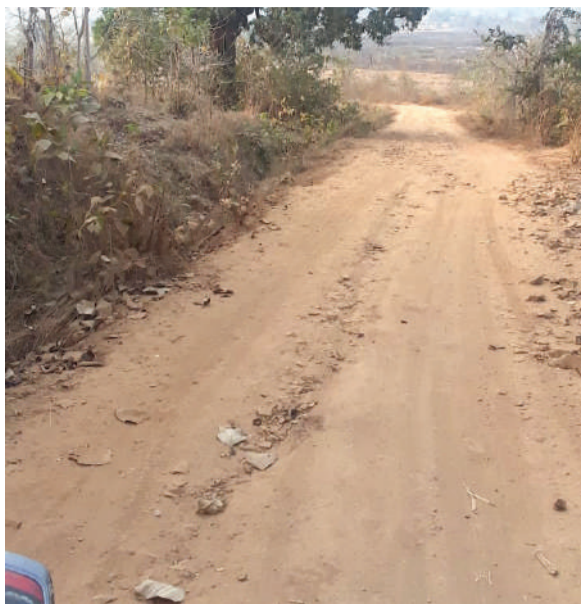
त्यामुळे खरच आम्हाला स्वातंत्र्य येथील ग्रामस्थांतून बोलताना मिळाले का? असा प्रॉजळ सवाल उपस्थित होत आहे.

या गावांना ७५ वर्षात अजून साधा रस्ताही मिळाला नाही. दुरुळ उडवण्यातील पाणी आणून महिलांच्या डोळ्यात अश्रू आजही उभे आहेत.