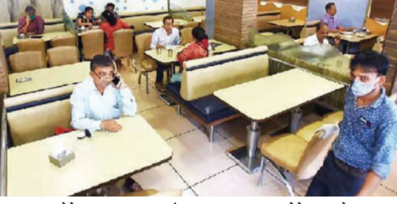
सुरुवात होते. मात्र, १० नंतर सुरु होणाऱ्या पोलीस बंदोबस्ताला धाबकून सध्या हॉटेलमध्ये येणे

जिल्ह्यातील हॉटेल व्यवसायिकांना दिलासा त्यामध्ये नव्याने सुरु होणारी पर्यटन स्थळे, शाळा, व्यापार यांचा विचार करता हॉटेलसाठी रात्री १० पर्यंतची वेळ ही गैरसोयीची ठरत होती. सर्वसाधारणपणे हॉटेलमध्ये येणारे ग्राहक हे रात्री नऊ वाजल्यानंतर हॉटेलमध्ये यायला