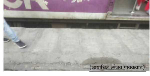
दरवाज्यामध्ये खूपच अंतर असल्याने एखादा प्रवासी दोघांच्या मध्ये अंतर असल्या कारणाने पडून जखमी होऊ शकतो.