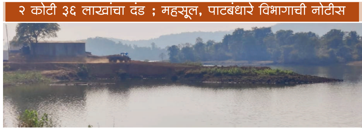
२ कोटी ३६ लाखांचा दंड ; महसूल, पाटबंधारे विभागाची नोटीस