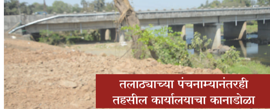
तलाठ्यांच्या पंचनाम्यांनंतरही तहसील कार्यालयाचा कानाडोळा

। पेण । वार्ताहर । पेण शहर आणि परिसरात होत असलेल्या अनधिकृत बांधकामांबाबत तलाठ्यांनी पंचनामा करूनही तहसील कार्यालयाकडून अद्यापही कोणत्याही प्रकारची कारवाई करण्यात आल्याचे दिसत नाही. अधिकाऱ्यांच्या दुर्लक्षतेमुळे इतिहासाचा ठेवाही नष्ट होण्याच्या मार्गावर असल्याचे दिसत आहे.