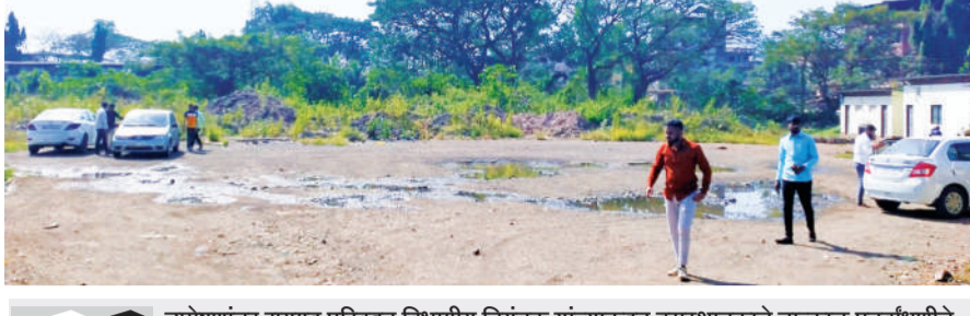
उपोषणांतर रायगड परिवहन विभागीय नियंत्रक यांच्याकडून बसस्थानकाचे तात्काळ पुनर्बांधणीचे लेखी पत्र देण्यात आले होते. परंतु एक वर्ष उलटून गेले तरीही कोणत्याच कामाला सुरुवात झालेली नाही. पुढील महिन्यात पुन्हा मी आमरण उपोषणास बसणार आहे. बसस्थानकाच्या पुनर्बांधणीचे काम सुरु होईपर्यंत हे उपोषण सुरु ठेवण्यात येणार आहे.

लाखांचा निधी मंजूर झाला आहे. मात्र ठेकेदाराला चालू वाढीव दर हवे असल्याने काम खोळंबले आहे. स्थानकाची जुनी इमारत पाडली खरी, मात्र जुन्या इमारतीचा राडारोडा येथे तसाच ठेवण्यात आलेला आहे. बाजूला तात्पुरत्या स्वरूपात प्रवाशी व कर्मचारी शेड बांधण्यात आली आहे. मात्र परिपूर्ण बसस्थानक इमारती अभावी प्रवासी व परिवहन कर्मचाऱ्यांची गैरसोय होत आहे. अनेक वर्षे थोकादायक