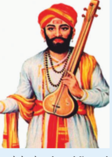
भेट द्या हो. तेव्हा देवालाही भक्ताची चिंता लागली व दया आली.

विचाराने त्यांना प्राप्त झाले. अखेर स्वतः मंदिरात जाऊन माप घेण्याचा निर्णय त्यांनी घेतला. मात्र, मंदिरात प्रवेश करताना त्यांनी स्वतःच्या डोळ्यावर पट्टी बांधली आणि विठ्ठलाच्या मूर्तीसमोर गेले. सोनसाखळी विठ्ठलाच्या कमरेला बांधत असताना, त्यांच्या हाताला व्याघ्र चर्म लागली. नरहरी सोनार यांचे हात गळ्यापर्यंत गेले असता, त्यांना शेष नाग असल्याचे जाणवले. नरहरी सोनारानी लगेच आपल्या डोळ्यावरील पट्टी काढली. बघतात तर काय समोर विठ्ठलच होता. नरहरी सोनार यांनी पुन्हा एकदा डोळ्यावर पट्टी बांधली परत पुन्हा तोच प्रकार घडला. अखेर प्रत्यक्ष परमेश्वराने त्यांना दर्शन देऊन सांगितले की, पांडुरंग परमात्मा शंकर भगवान आहे. शिव आणि विष्णू भिन्न नाहीत एकच आहेत, हे सर्व देव विठ्ठलाच सामावलेले आहेत.