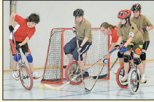
खेळाडूंना युनिसायकल चालवत हा खेळ खेळायचा असतो. हॉकी खेळताना युनिसायकलवरचा पाय काढण्याची परवानगी खेळाडूंना नसते. त्यामुळे

स्पर्धांच्या आयोजनाला सुरुवात झाली. नाथन 'हॉटडॉग इटिंग कॉन्टेस्ट' मुळे हा प्रकार खूपच लोकप्रिय झाला. ही स्पर्धा दरवर्षी चार जुलैला आयोजित केली जाते. अमेरिकेसह, कॅनडा आणि जपानमध्येही अशा स्पर्धा आयोजित केल्या जातात. फन टाईम हॉकी हा खेळ विविध प्रकारे खेळला जातो. 'आईस हॉकी', 'अंडरवॉटर हॉकी' असे प्रकारही लोकप्रिय आहेत. 'युनिसायकल हॉकी' हा खेळ अनेक ठिकाणी खेळला जातो. या हॉकीमध्ये