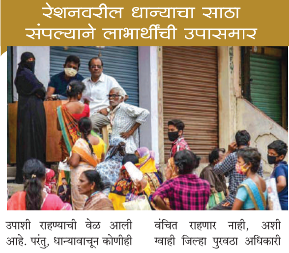
उपशी राहण्याची वेळ आली आहे. परंतु, धान्यावाचून कोणीही वंचित राहणार नाही, अशी व्हाही जिल्हा पुर्वटा अधिकारी

। चौल । प्रतिनिधी । माथाडी कामगारांच्या संपामुळे मागील पंधरा दिवसांपासून पनवेलच्या एफसीआय या दोन्ही डेपोंमधील अन्नधान्याची उचल बंद आहे. परिणामी, जिल्ह्यातील रास्त भाव धान्य दुकानातील धान्याचा साठा संपला आहे. धान्यच शिल्लक नसल्यामुळे नागरिकांना रिकाम्या हाती दुकानातून परत फिरावे लागत आहे. १९ जानेवारीपासून रास्त भाव दुकानात धान्याचा खडबडट आहे. कोरोनाच्या काळात आधार ठरलेली रास्त भाव दुकाने धान्यावाचून जनतेची