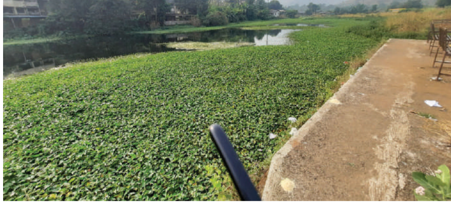
आली आहे. कारण नेरळ गावातील लोक सायंकाळी विरंगुळा म्हणून ज्या धरणवर सध्या फिरायला जातात,

करजत तालुक्यातील नेरळ ग्रामपंचायतीकडून आयोजित केला जाणारा गणेश विसर्जन सोहळा गणेश घाट आणि ब्रिटिश कालीन तलावावर मोठ्या थाटामाटात केला जातो. त्याच धरणातील पाणी शोधण्याची वेळ नेरळच्या रहिवाशी यांच्यावर आली आहे. कारण नेरळ गावातील लोक सायंकाळी विरंगुळा म्हणून ज्या धरणवर सध्या फिरायला जातात,