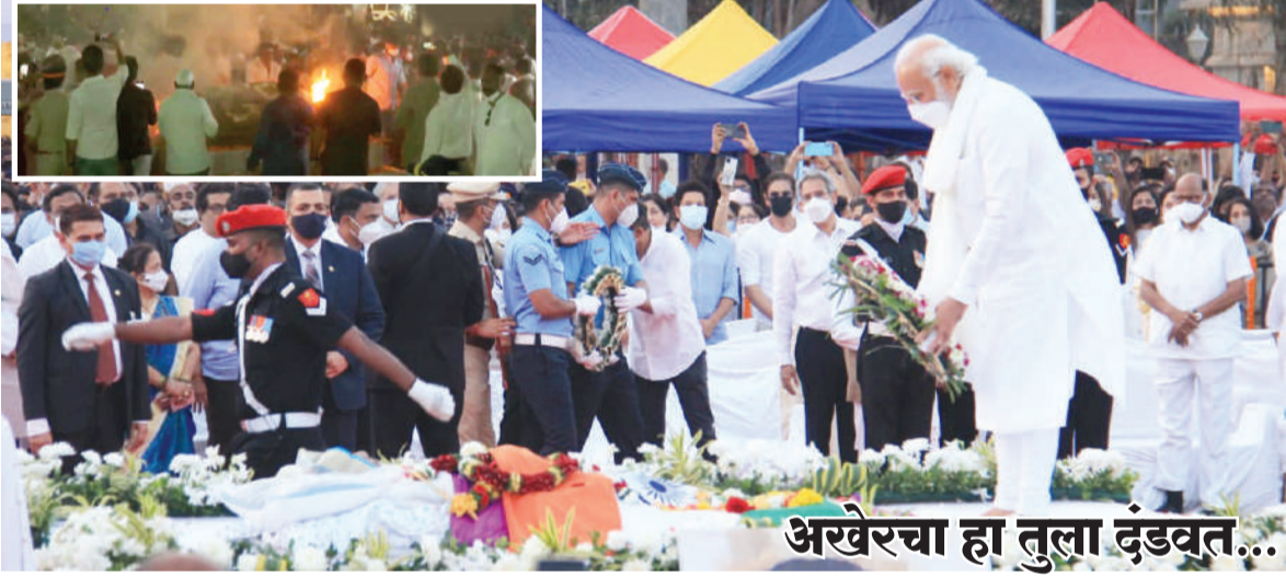
अखेरचा हा तुला दंडवत...

। मुंबई । प्रतिनिधी । लतादीदींचे पार्थिव दुपारी त्यांच्या प्रभूकुंज या निवासस्थानी अंत्यदर्शनासाठी ठेवण्यात आले होते. तेथे मुख्यमंत्री उद्धव ठाकरे यांच्यासह विविध क्षेत्रातील मान्यवरांनी त्यांच्या पार्थिवाचे अंत्यदर्शन घेत आदरांजली वाहिली. त्यानंतर सायंकाळी त्यांचे पार्थिव तिरंग्यात लपेटून शिवाजी पार्क येथे नेण्यात आले. अंत्ययात्रेत मंगेशकर परिवारही सहभागी झालेला होता. शिवाजी पार्कवर पोलिसांनी बंदुकीच्या